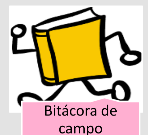
Bitácora de campo